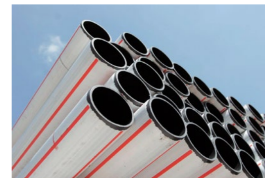
Mit Kunststoffabfällen aus Haushalten hergestellte Endprodukte