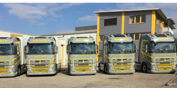
Euro-6-Flotte für Stückgut- und Lebensmitteltransporte der Hans Mathys AG

MEHR RECYCLING. MEHR UMWELT. MEHR SCHWEIZ.