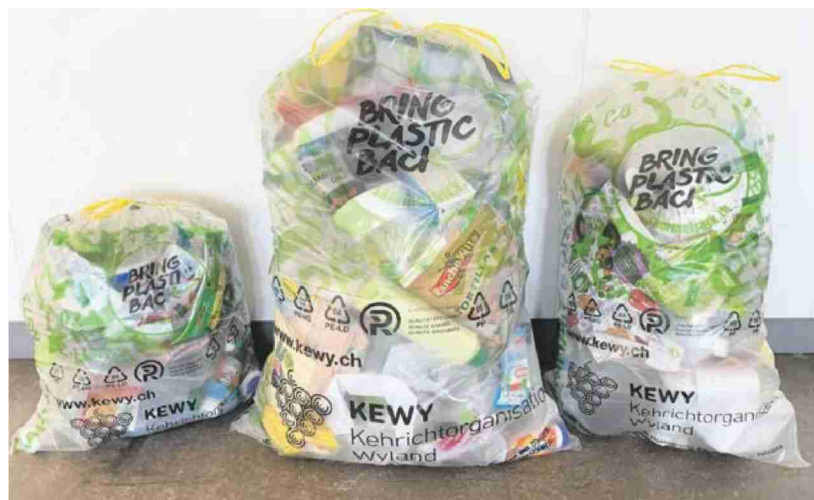
Ab 1. Januar 2023 wird im gesamten KEWY-Gebiet mit diesen Sammelsäcken Haushalt-Kunststoff gesammelt: Mitmachen und mitsammeln ist angesagt!

Weitere Informationen finden Sie unter www.sammelsack.ch Telefon: 071 552 42 42 E-Mail: info@sammelsack.ch