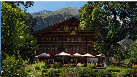
Landgasthof Ruedihus, Kandersteg