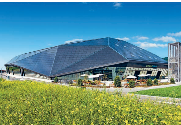
Umwelt Arena, Spreitenbach

Die vier Hauptpartner Zürcher Kantonalbank, Coop, Energie 360° AG und ABB Schweiz sowie über 100 Ausstellungspartner heissen die Besucher in der Umwelt Arena Spreitenbach willkommen.